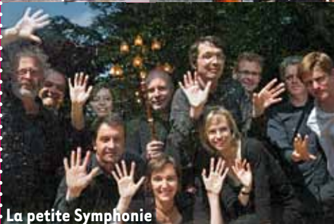
La petite Symphonie