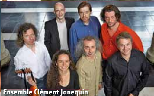
Ensemble Clément Janequin